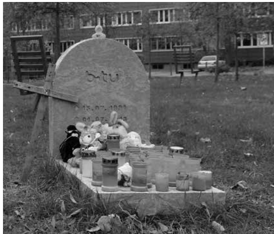
Abb. 3: Symbolisches Grab auf dem Campus der BTU in Cottbus